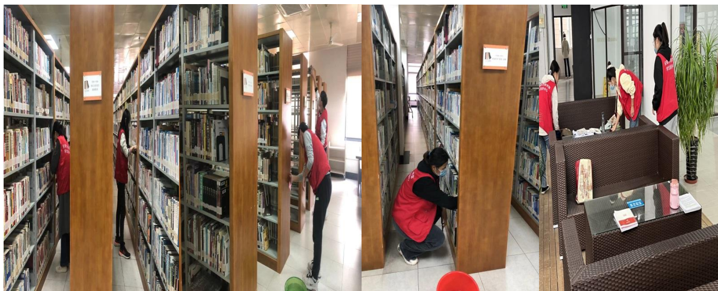
学服中心学生志愿者服务