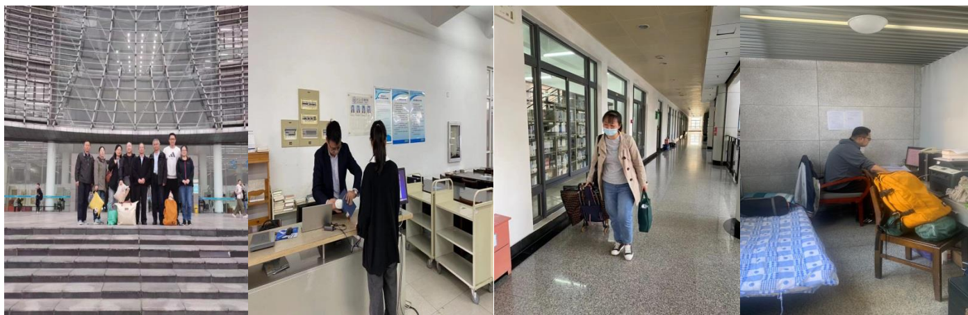
校园封闭期间坚守岗位的馆员们

10月底到11月，随着合肥市疫情形势的发展，我校疫情防控应急预案启动，全校上下迅速响应，图书馆领导班子也制定出坚持开放、保障线下阅读的大方案。全体员工积极响应政策，创造条件，保证两点一线，在家人的支持和员工的互相帮助中，为师生学习科研提了供持续性的服务。校园封闭期间，图书馆前后派出三批员工，住校提供流通阅览服务。早八点到晚十点，连续多日，睡办公室、阅览室。在保证防疫的前提下，满足了考研前夕读者对图书馆的强烈需求。并且根据疫情防控政策的调整，第一时间重启通借通还服务，保障蜀山和金寨路校区读者的学习需求。