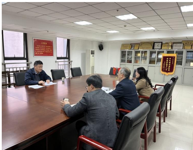
高副校长莅临我馆调研指导工作

3月2日上午，我馆召开图书馆十四五规划研讨暨本年度重点工作推进会议，图书馆党政领导和各部室主任参加此次会议。