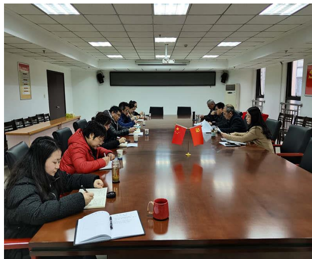
本年度重点工作推进会议

图书馆党总支组织召开总支会议、理论学习中心组会议，传达学习学校意识形态工作文件精神；各支部认真开好2021年度组织生活会。全面落实学校第二巡视组巡视图书馆相关整改工作。