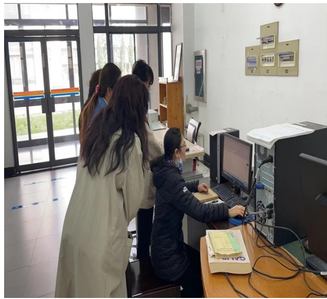
组织员工学习期刊分编