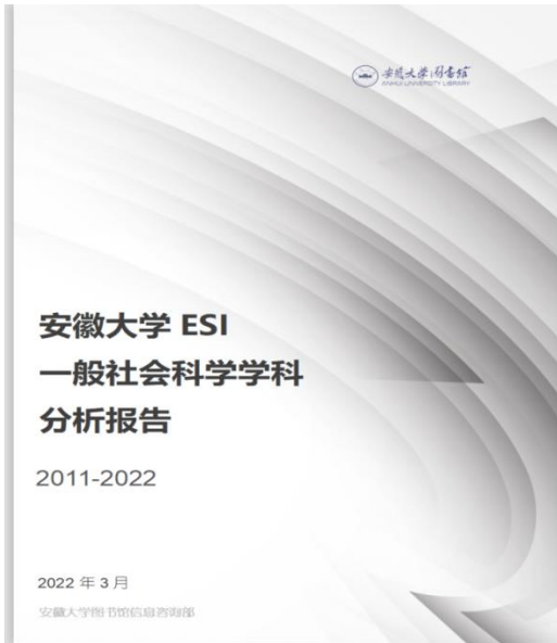
供学校参考的分析报告