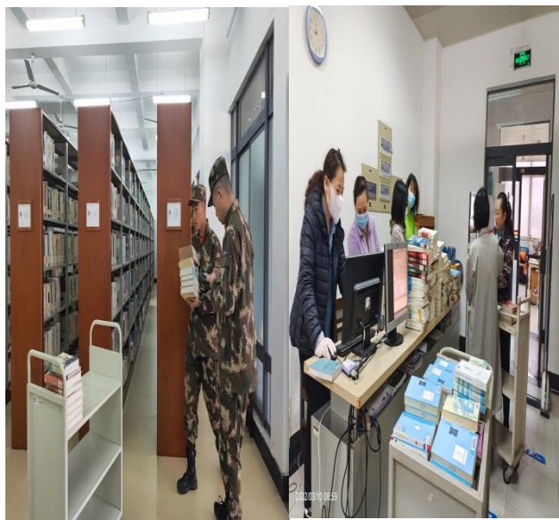
为武警支队办理图书借阅

做好共建单位服务。样本书阅览室为安徽武警机动支队一大队办理图书借阅近1500册。