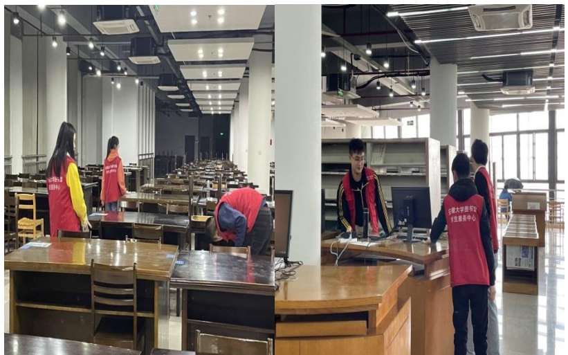
学生志愿者清理阅览室

指导学服中心开展工作：文典阁清场29次，桌面清理8次，研修室清理29次，招募志愿者累计548人次。逸夫馆共开展志愿活动15次，招募志愿者总计142人次。