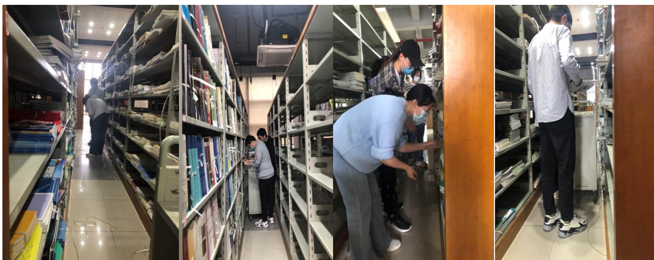
2018级图书馆学本科生在阅览室实习

完成2021年度考核、师德考核工作。做好2018级图书馆学本科生来馆实习安排和指导工作。