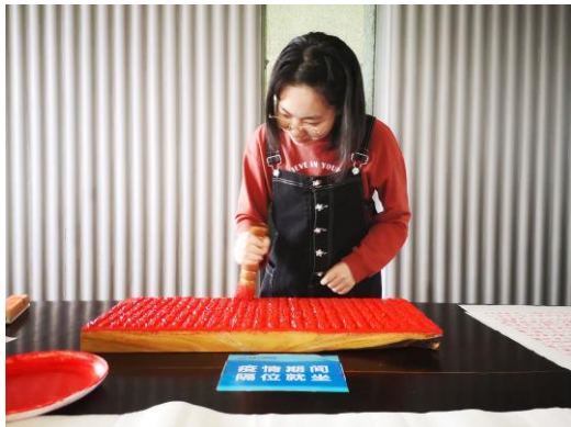
同学在为木雕版刷墨

为了响应习近平总书记“让收藏在禁宫里的文物、陈列在广阔大地上的遗产、书写在古籍里的文字都活起来”的重要讲话精神，值此世界读书日到来之际，图书馆特藏阅览部、活动与发展部于 4 月 25 日-26 日在磬苑校区和龙河校区联袂举办了为期两天的“指尖上的古籍”体验活动。图书馆党总支书记彭丹菊、副馆长彭少杰到场支持并为活动揭幕。